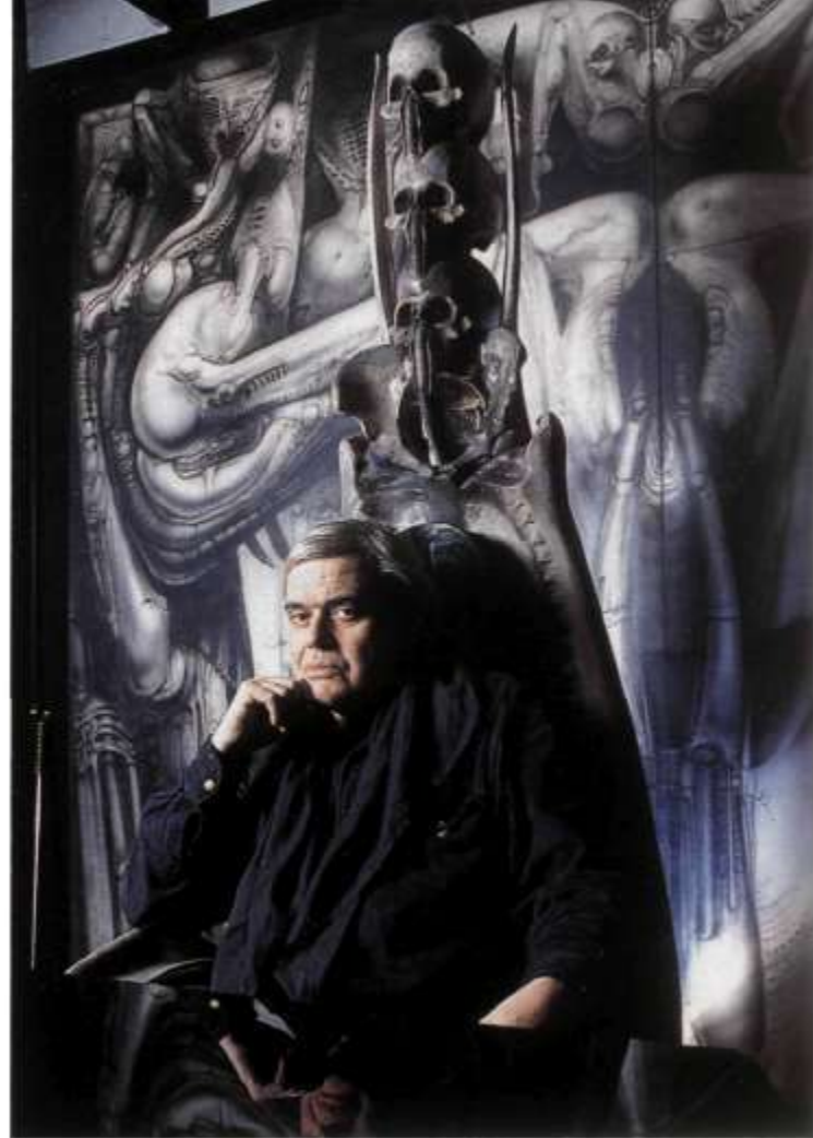
H. R. GIGER

Wenn es um Horror geht, kommt Hollywood zu H. R. Giger: Der Schweizer ist ein Star-Designer, der auch für den neuen Film «Species» engagiert wurde. Sensationell: Für TELE öffnete Giger erstmals Haus und Garten, in dem eine faszinierende «Geisterbahn» herumfährt.