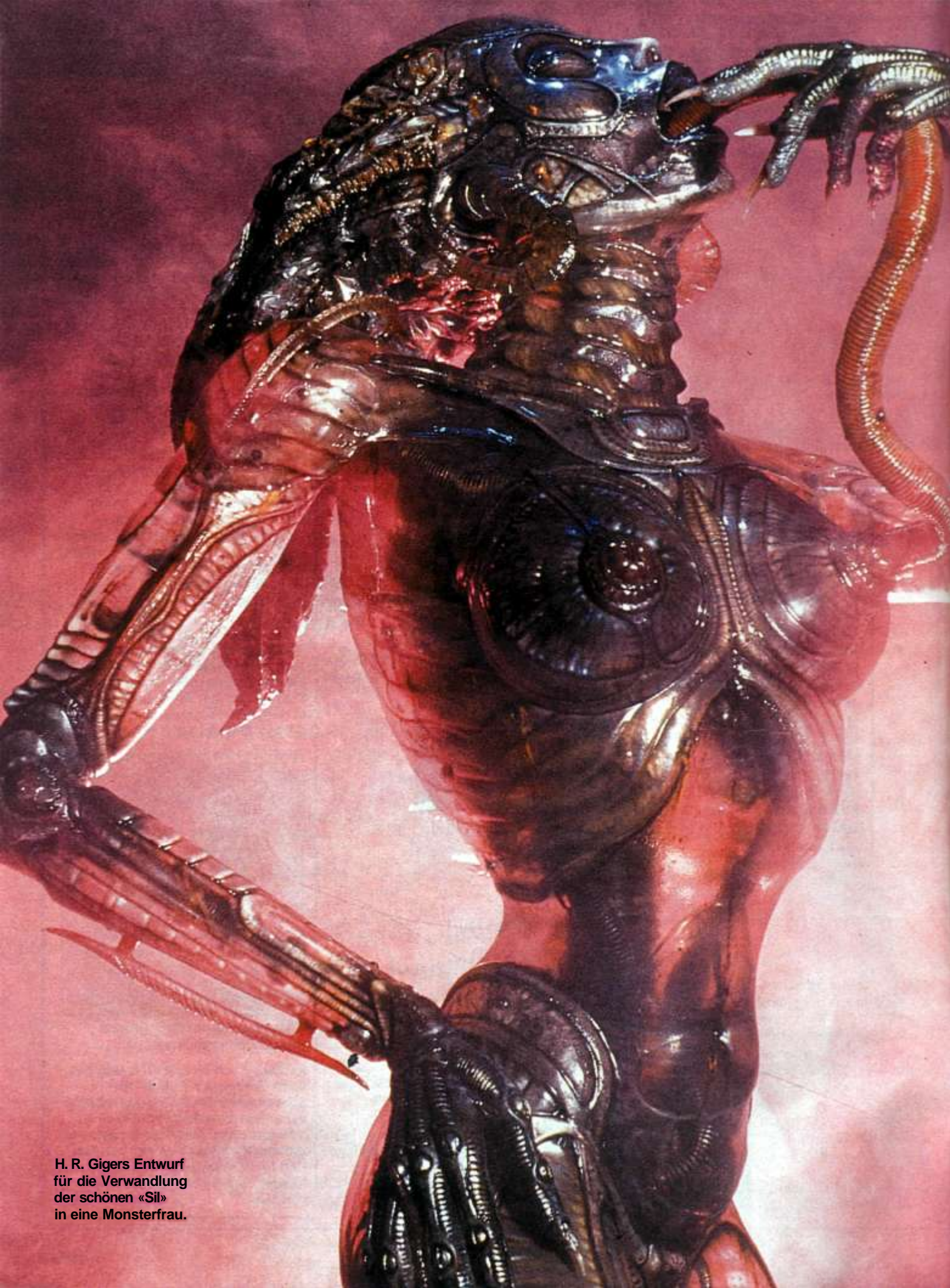
H. R. Gigers Entwurf für die Verwandlung der schönen «Sil» in eine Monsterfrau.