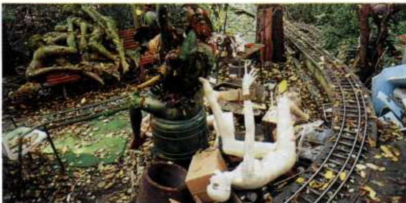
Die «Geisterbahn» in Gigers Garten: ein verwirrendes, irritierendes und chaotisches Horror-Kabinett.